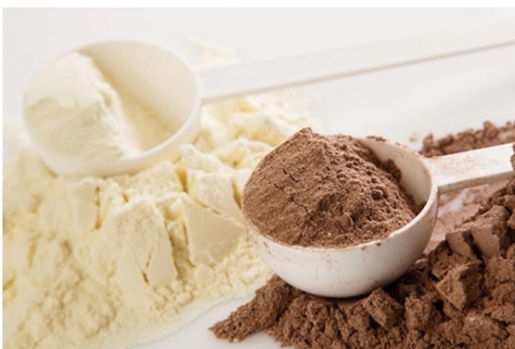
La industria de suplementos alimenticios trabaja de forma permanente con autoridades, academia, comunidad científica y sociedad en general

En México, la regulación señala que los suplementos alimenticios pueden presentarse en forma farmacéutica y su consumo debe ser vía oral, por ejemplo: pastillas, cápsulas, tabletas, polvos, líquidos, barras, entre otras formas orales.